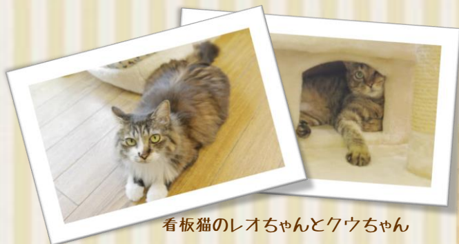
看板猫のレオちゃんとクウちゃん