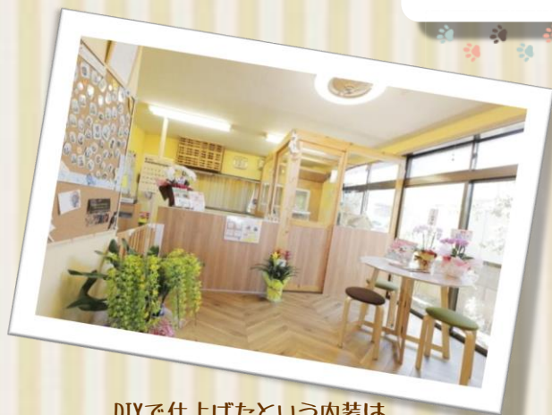
DIYで仕上げたという内装はナチュラルで落ち着いた雰囲気

当社でご契約いただいているお客様をご紹介します！ 今回は新発田市の Dog&Cat トリミングサロンMARU 様です！