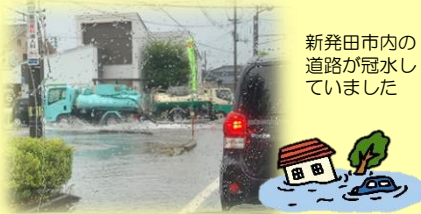
新発田市内の道路が冠水していました

人は、異常な事態に遭遇すると「まだ大丈夫」「自分には起きないだろう」と思って平常心を保とうとします。いざというときに動けるように災害時の行動を考えておきましょう。