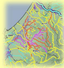
新発田市の河川が氾濫警戒レベルに