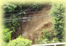
新発田市滝地内で土砂崩れがおき国道が通行止めに

近くに河川がなくても下水が溢れて床下 浸水 したり、家が 高台 にあつたとしても 土砂崩れ が発生する場合があります。今回の新発田市の被害はどちらも発生しました。 戸建てにお住まいの方は水災に備えることをおすすめします！ 現在ご加入の火災保険は洪水や土砂崩れにより建物や家財が被害を受けたとき、どのくらい補償されますか？